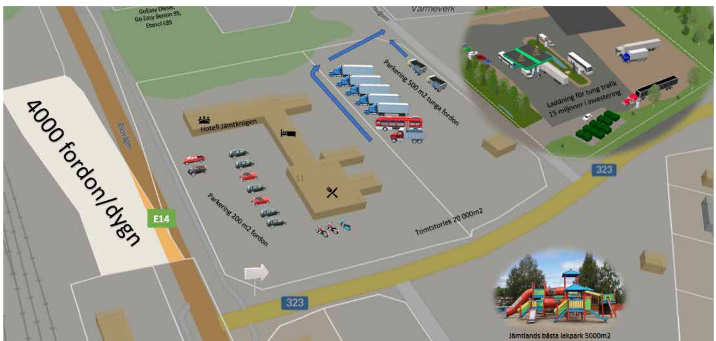
Exempel på hur framtiden i Bräcke samhälle kan se ut.