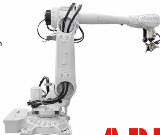
ABB Robotics är en av världens ledande leverantörer av robotik och maskinautomation och det enda företaget med en omfattande och integrerad portfölj som omfattar robotar, AMR och maskinautomationslösningar – utformade och styrda av vår värdeskapande programvara-

Vårt arbete sker i enlighet med FN:s globala mål för en hållbar utveckling, Agenda 2030.