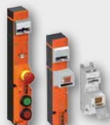
SAFEMASTER STS säkert nyckel-, lås och förreglingsbrytarsystem