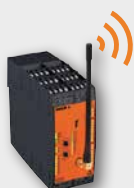
SAFEMASTER W trådlös maskinsäkerhet