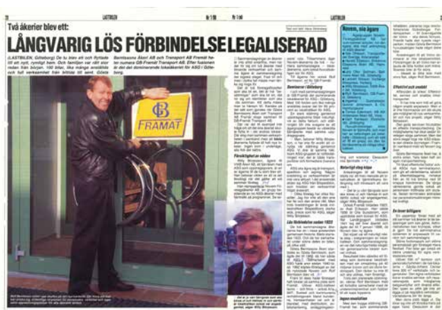
Artikel från Lastbilen 1 - 1990

1989 Efter bildandet av GB Framåt Transport AB börjar bolaget transportera för storkunder som ASG, SKF och Arla.