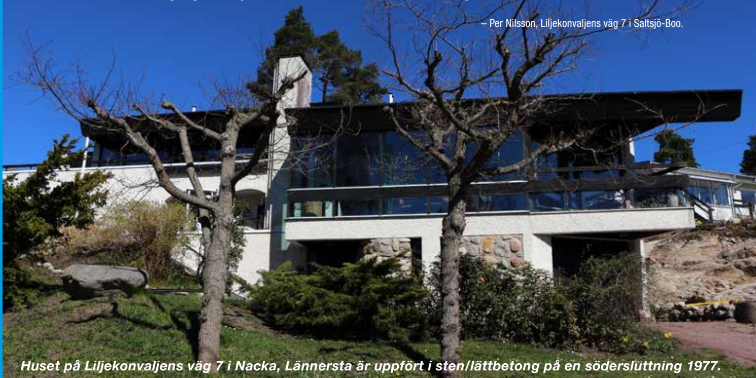
Huset på Liljekonvaljens väg 7 i Nacka, Lännersta är uppfört i sten/lättbetong på en södersluttning 1977.