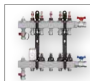
Nya rostfria fördelare