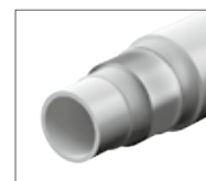
Flexibla 5-lagers Pe-RT rör